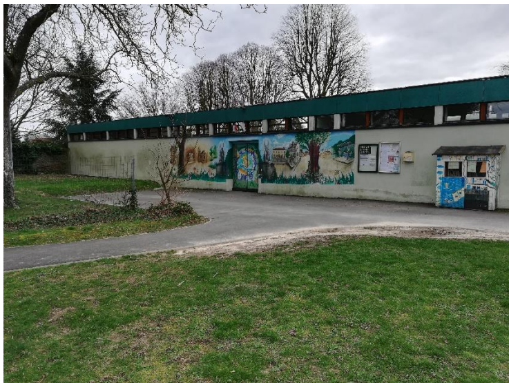
Les entrées et les sorties se font par l'entrée principale de l'école

Vous pouvez formuler une demande de dérogation lors de l'inscription des PS pour aménager l'emploi du temps de votre enfant. Pas de départ ni de retour possible à 13h20 pour les PS.